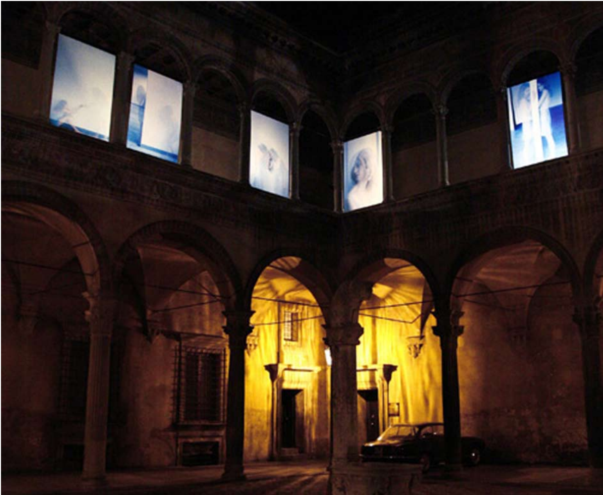
Bologna art fair Bologna