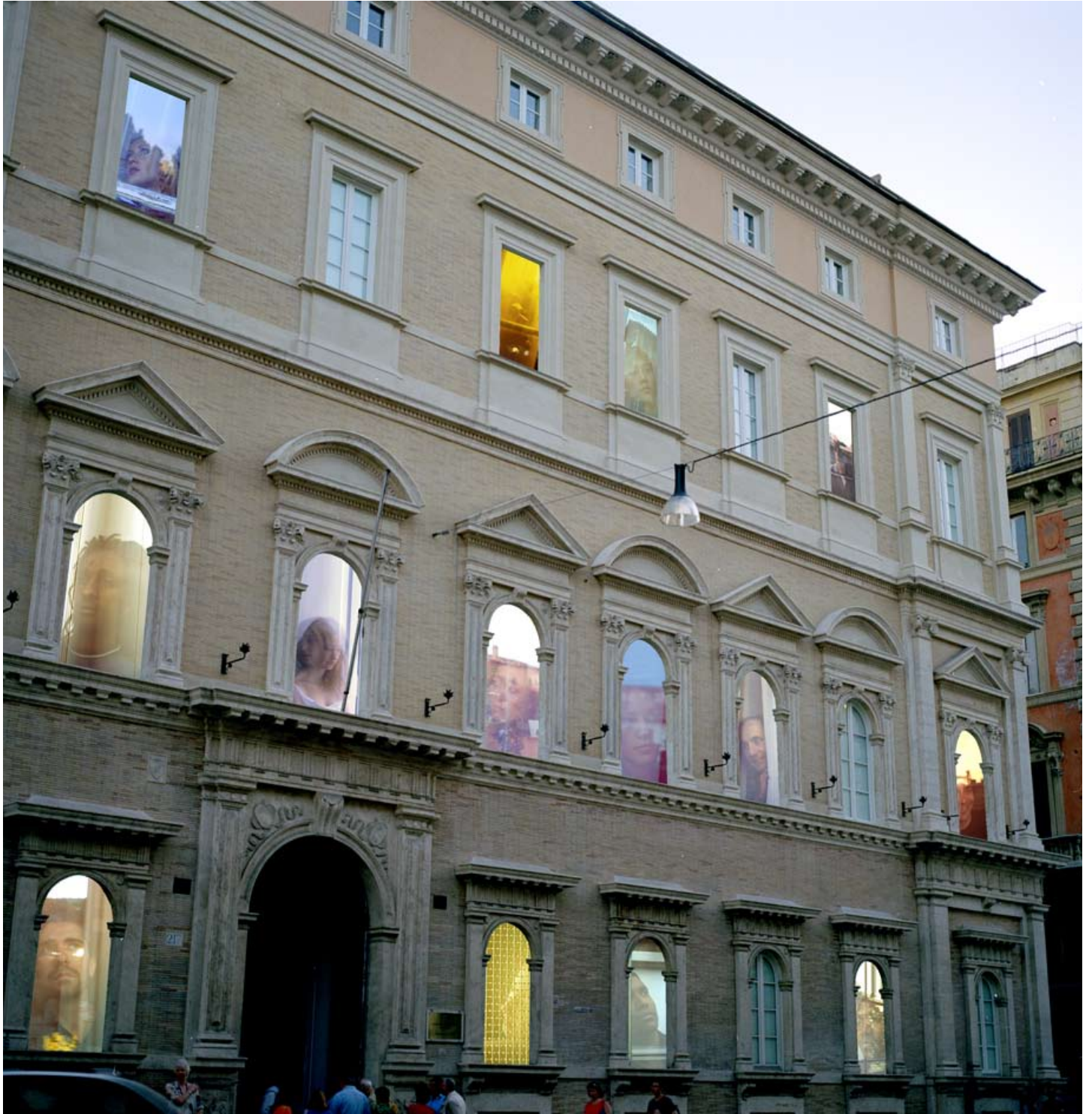
Light building Rome